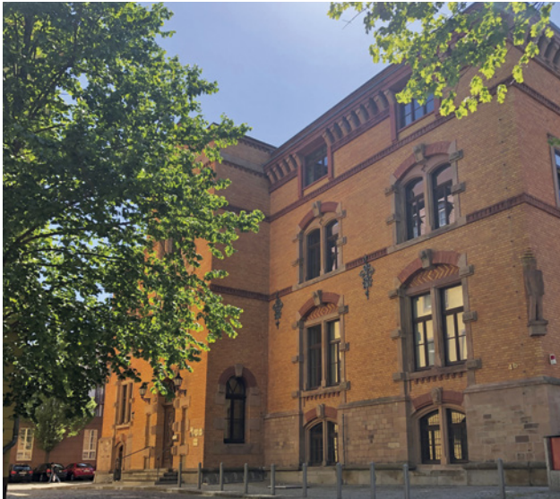
مُديريّة الصحة في شارع أوبرالتينبورغ في ميرزبه بورغ

تتوفّر لدينا إمكانية إجراء زيارات منزلية في الحالات الخاصة يُرجى التّواصل معنا بهذا الخصوص.